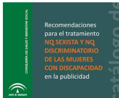
Portada del catálogo.

Asimismo, se ven afectadas por la imagen que las campañas publicitarias proyectan de las mujeres, con marcadas actitudes machistas y arraigados patrones androcristas que perjudican gravemente a las