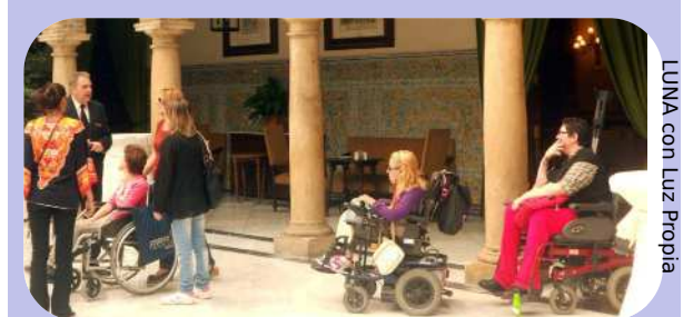
LUNA con Luz Propia