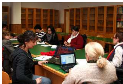
Valencia se reúne con la CEMUDIS.

La nueva organización se encargará de la defensa de los derechos de las mujeres del colectivo y sus principales objetivos pasarán por visibilizar a estas mujeres en la comunidad, potenciar su empoderamiento y ofrecer formación para prevenir