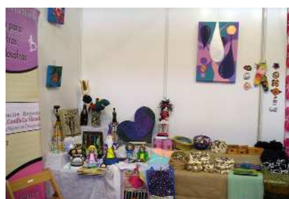
'Stand' de mujeres de COCEMFE.

Las participantes, en colaboración con el Centro de Empleo ACIMAN, perteneciente a COCEMFE Castilla-La Mancha, han expuesto productos de artesanía tradicional como cerámicas, marroquinería o prendas elaboradas con ganchillo.