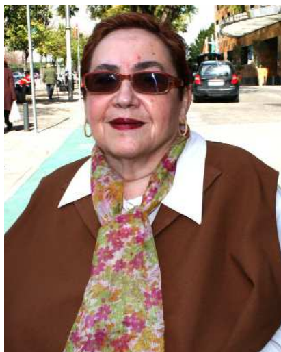
Federación LUNA Andalucía

El libro, titulado Activistas , es el tercer y último libro editado por CERMI para documentar los