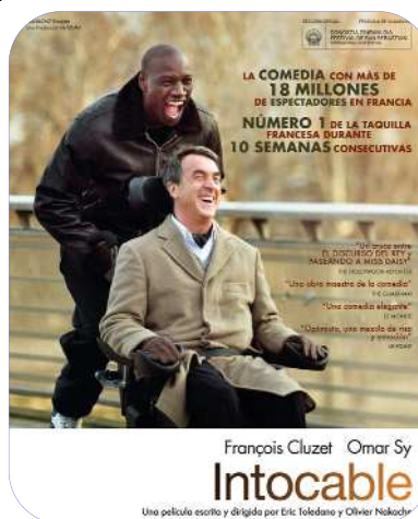
Cartel de la película.

Las asistentes, que disfrutaron mucho de la película y se sintieron muy identificadas con algunos de los sentimientos y comportamientos del personaje principal, según declararon al final del taller, expusieron algunas experiencias similares que habían afrontado en sus vidas y las dificultades y afinidades que habían encontrado en la relación con personas de su entorno. De igual forma, pusieron en común vivencias relacionadas con los cuidados asistenciales y problemas que surgen de manera habitual en estas relaciones como los relacionados con la intimidad.