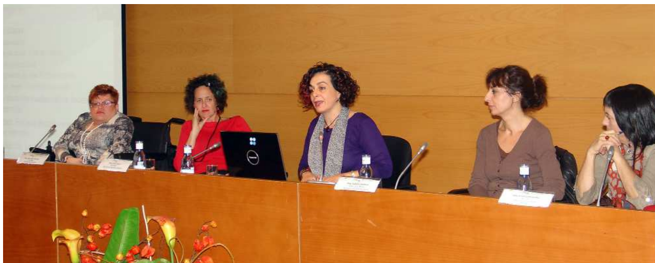
Mesa redonda Reivindicando la realidad sexual y reproductiva de las mujeres con discapacidad.