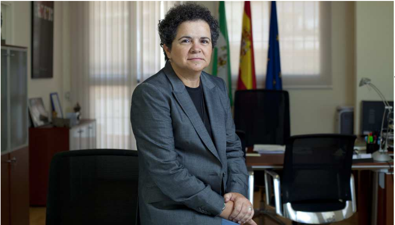
Instituto Andaluz de la Mujer

“Las víctimas de violencia machista deben saber que cuentan con toda una red de recursos a su disposición”