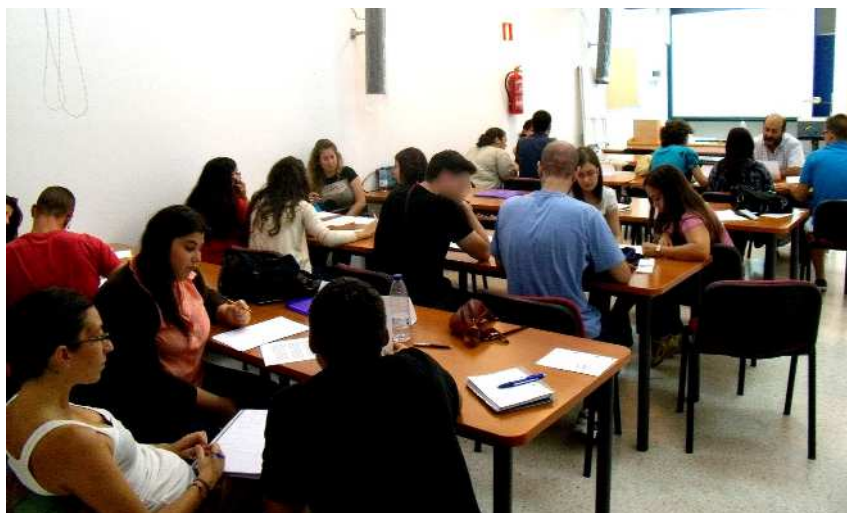
Federación LUNA Andalucía